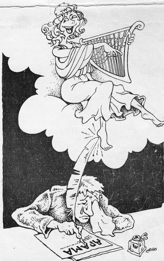
Рисунок С. Ашмарина