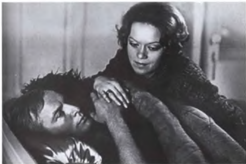
Командор – «Анна и Командор». Анна – Алиса Фрейндлих