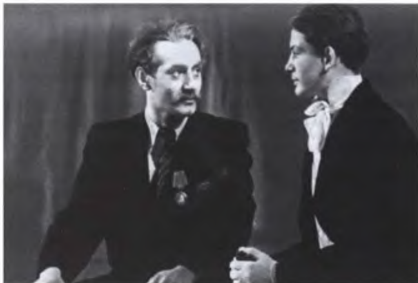
С Игорем Таланкиным – будущим знаменитым кинорежиссером