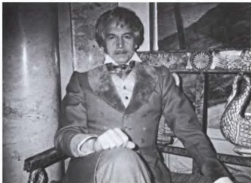
Иван Петрович Берестов – «Барышня-крестьянка»