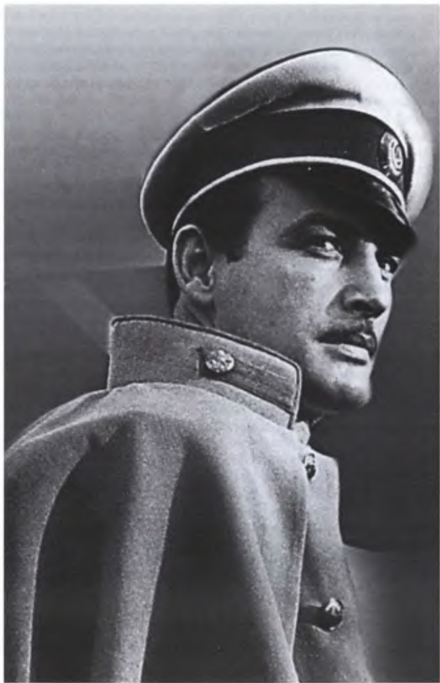
Вронский – «Анна Каренина»