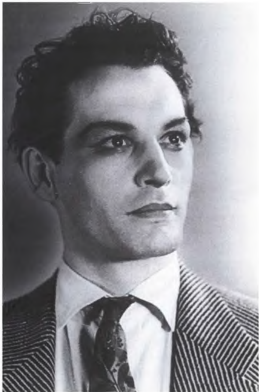
Жонваль - «6 этаж»