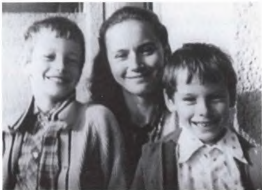
Мама с сыновьями