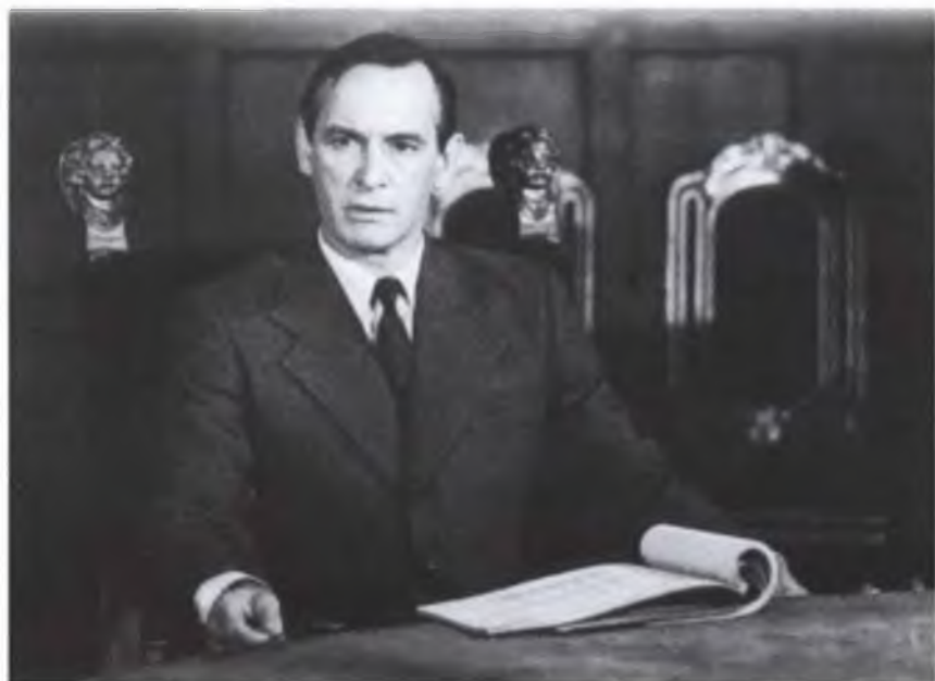
Озвучание двадцати серий фильма «Великая Отечественная»