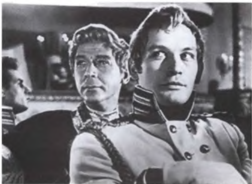
Анатоль. Долохов – О. Ефремов