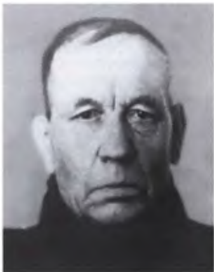
Отец и мать. Всю жизнь вместе. Светлые, добрые, прекрасные люди