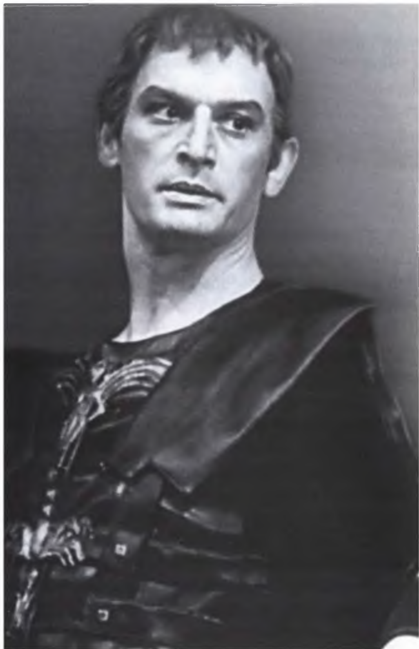
Цезарь – «Антоний и Клеопатра». Моя любимейшая роль. 1972