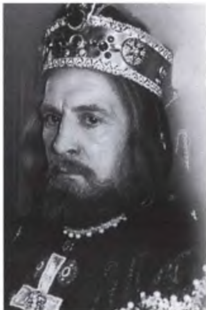
Император Константин Багрянородный – в фильме о закате Византийской империи