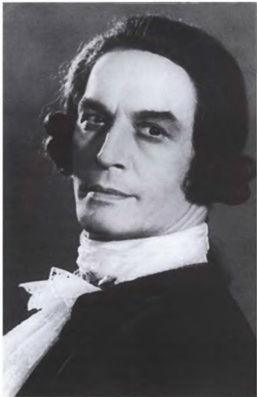
Казанова (средний возраст)