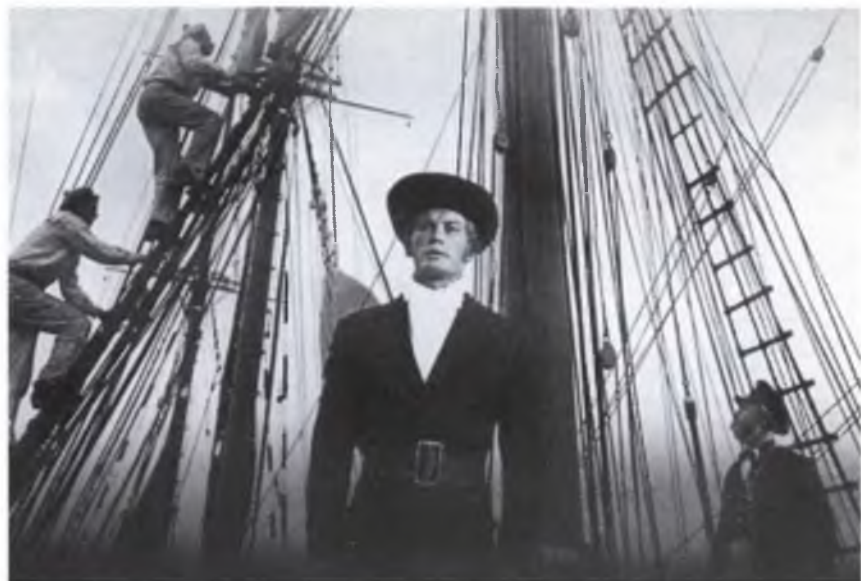
Красивейшая сказка человечества – «Алые паруса» А. Грина