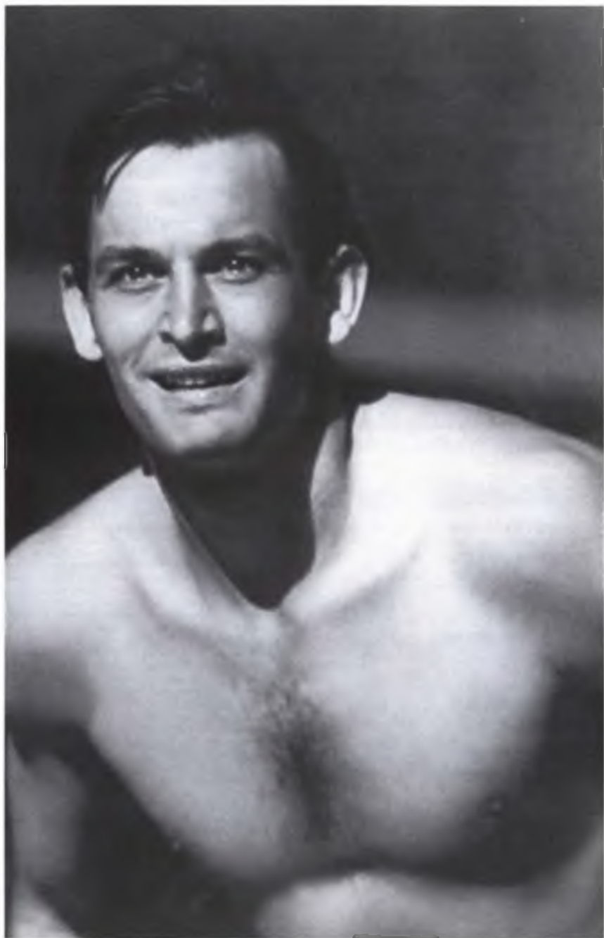
Спорт – постоянное увлечение. Люблю волейбол