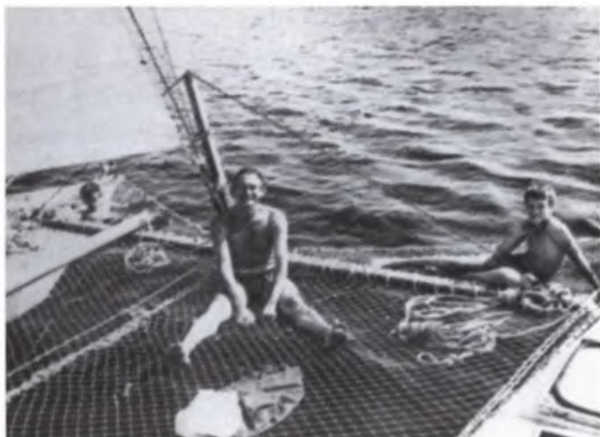
Больше всего любил отдых с сыновьями – Серезкой и Сашкой