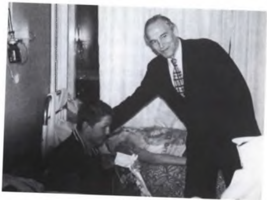
Госпиталь, у раненых в Ханкале и Гудермесе