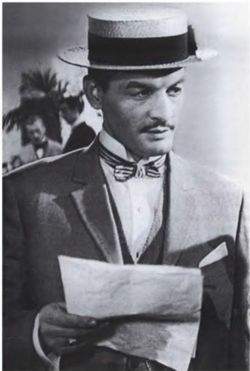
Чен – Пароль не нужен». Единственная роль, где меня не узнала мама