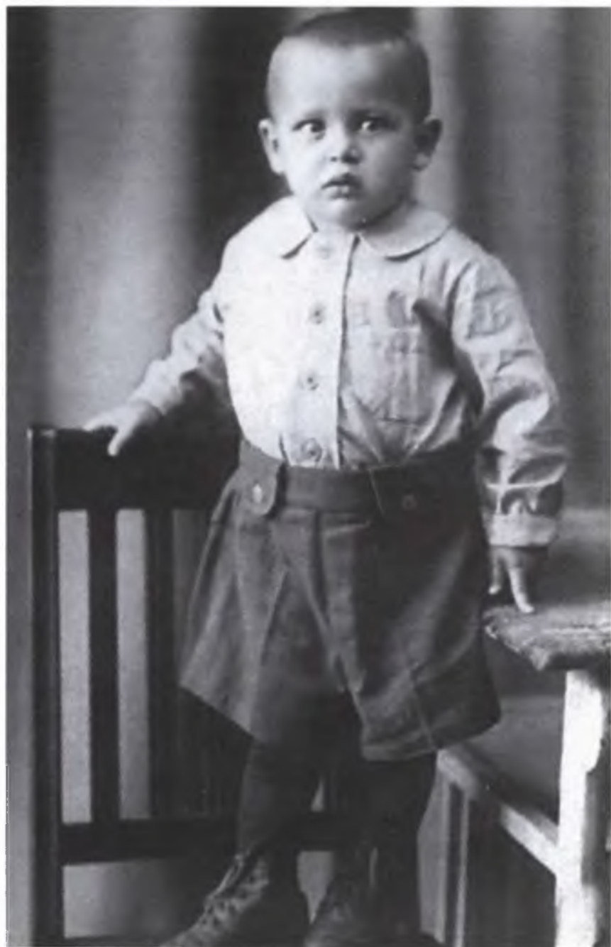
Будущий Калаф и Дон-Жуан – пока ему год с небольшим