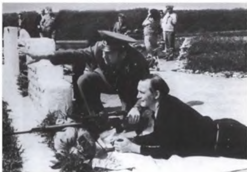
Многие годы возглавляю фонд «Армия и культура». Мы бывали во многих горячих точках. Чечня. Стрельбы