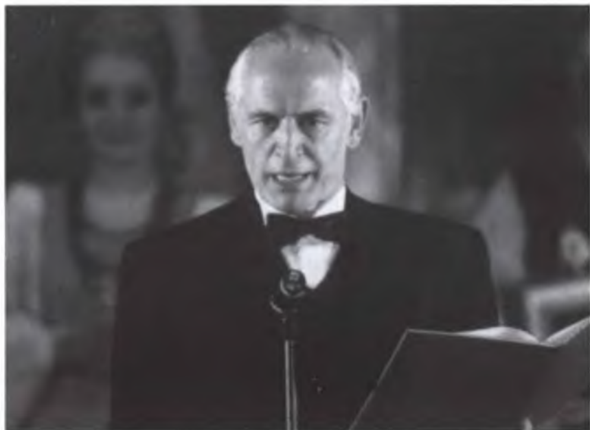
Концерт «Дни Москвы» в Австрии