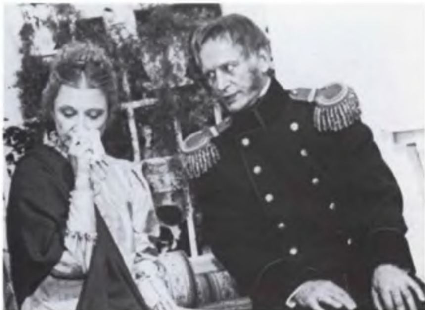
Александр I – «Незримый путешественник». Лиз – Алла Демидова