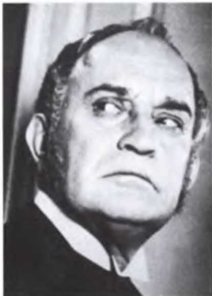
Великий вахтанговский актер Николай Гриценко