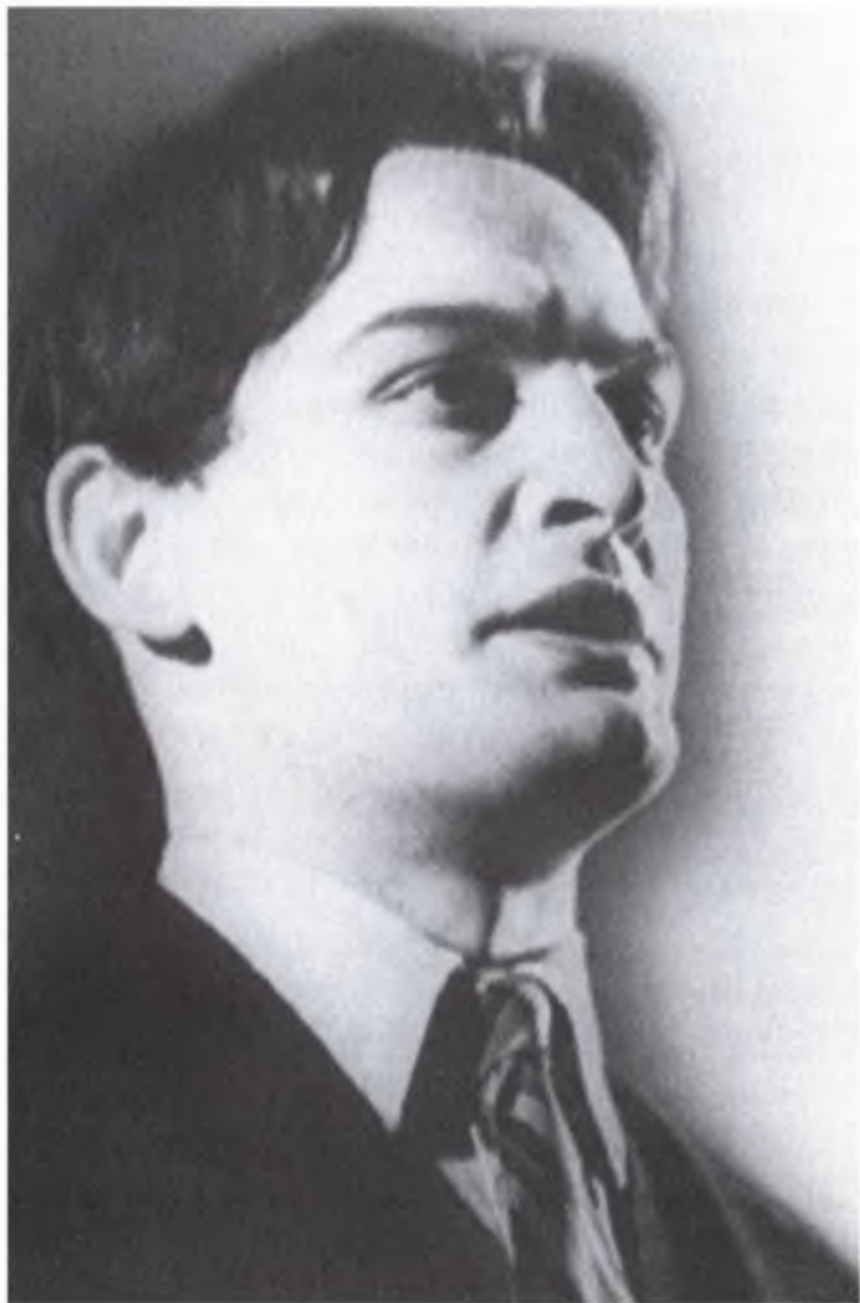
Маяковский – «Копармия»