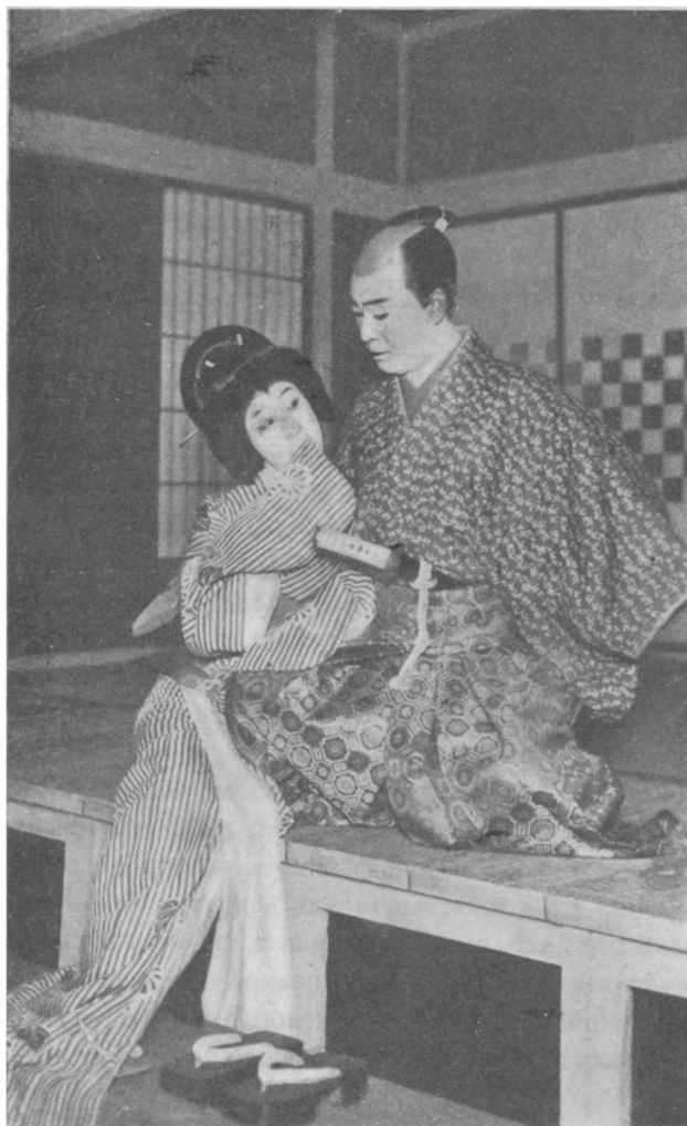
Садандзи и Сѣтѣ в пьесе Бантѣ Сараяики