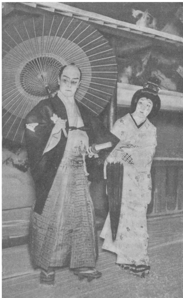
Садандзи и Сѣтѣ