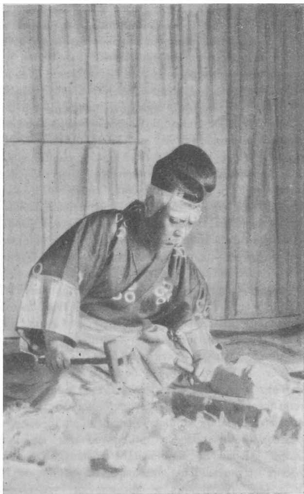
Садандзи в пьесе Сюдзэндзи-Моногатари