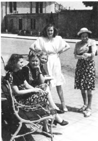
1947 г. Шефская поездка в Австрию в составе театральной бригады