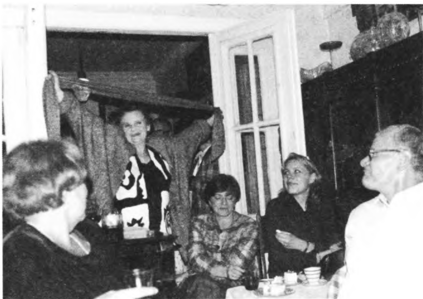
1998 г. Вечер памяти Людмилы Целиковской у нас дома