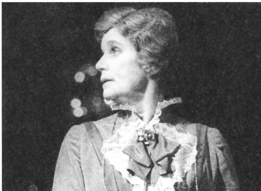
Графиня Мягкая в спектакле «Анна Каренина»