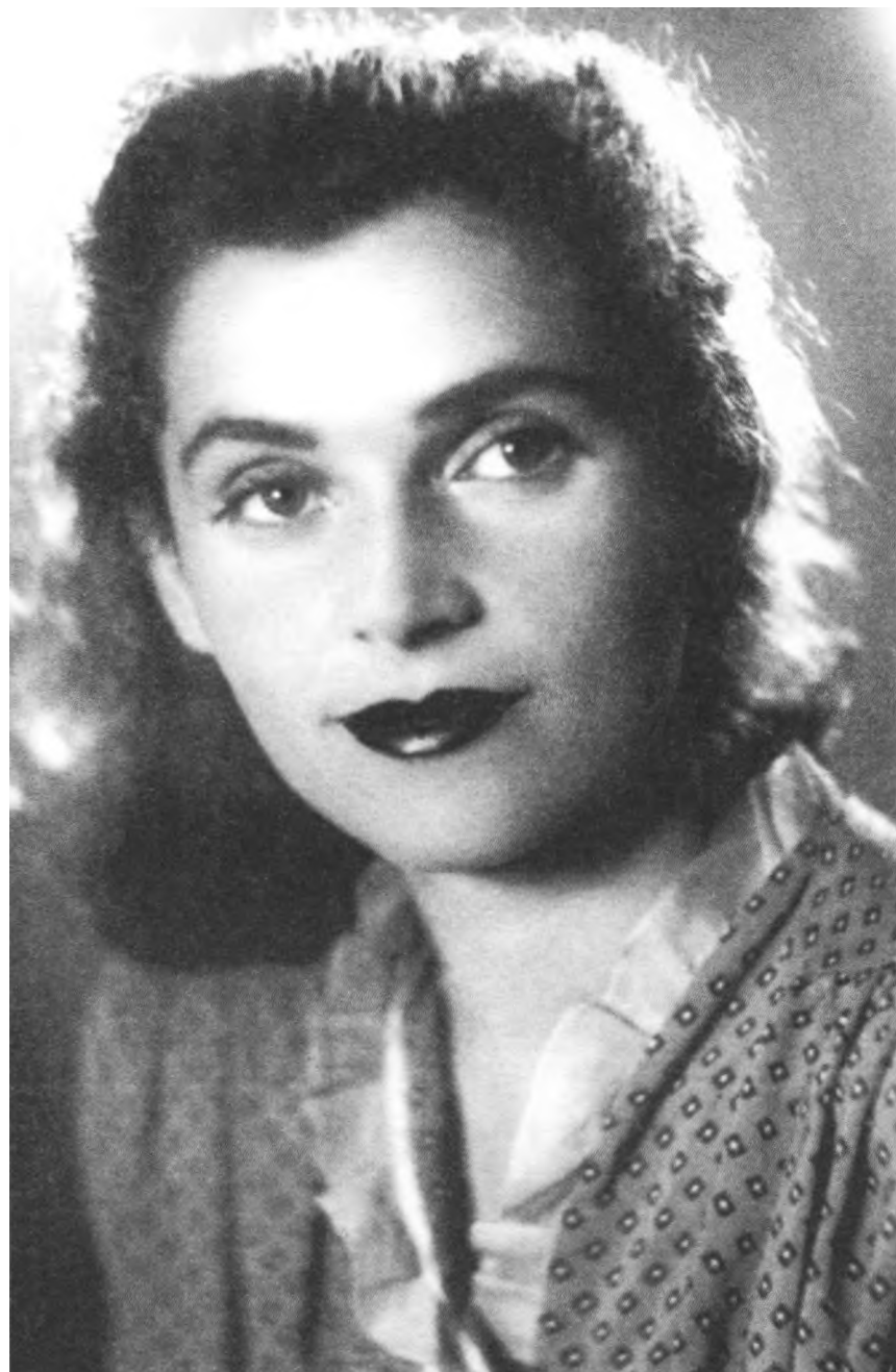
1940 г. Фото для выставки портретов театральных актеров