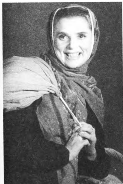
1966 г. «Конармия» по И. Бабелю