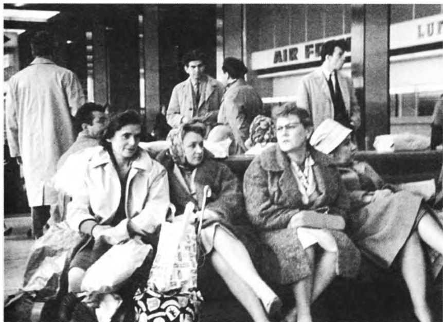
1962 г. Гастроли во Франции. В аэропорту Парижа