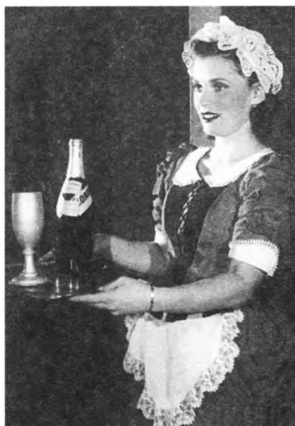
1942 г. «Сирано де Бержерак» Э. Ростана