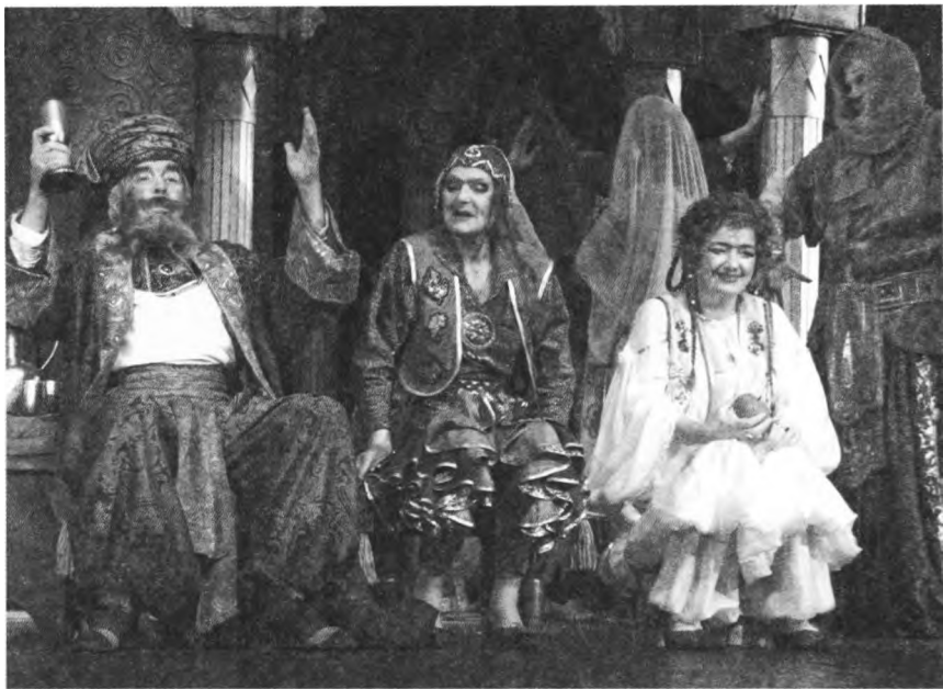
«Али-Баба и сорок разбойников». Сцена из спектакля