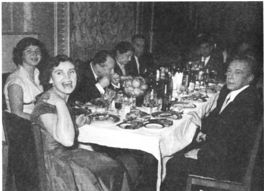
Встреча Нового 1948 года в театре Вахтангова