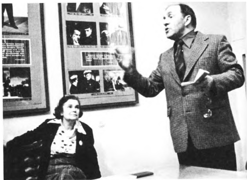
Встреча со зрителями. Выступает Михаил Ульянов