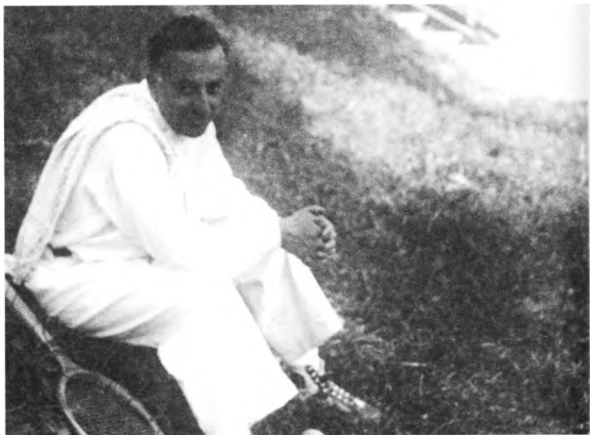
Рубен Николаевич Симонов. 30-е годы