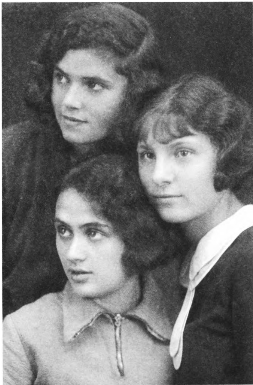
1933 г. Рабфак редакционно-издательского института. Я (в центре, вверху) с подругами