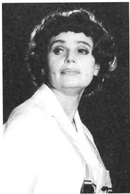
1974 г. «Игра в каникулы»