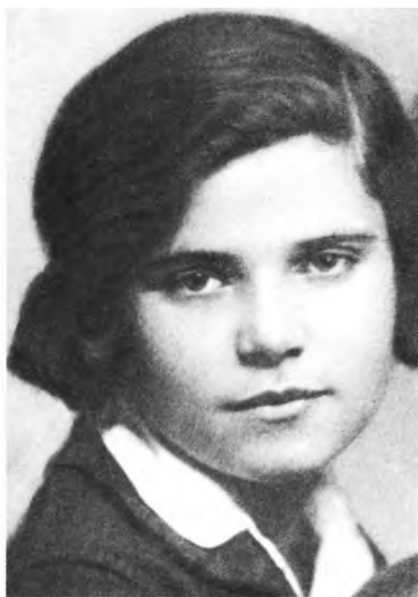
1931г. Ученица школы фабрично-заводского ученичества (ФЗУ)