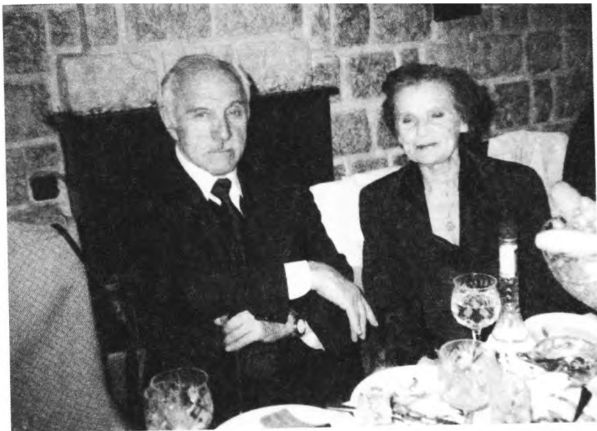
2002 г. 75-летие Михаила Ульянова