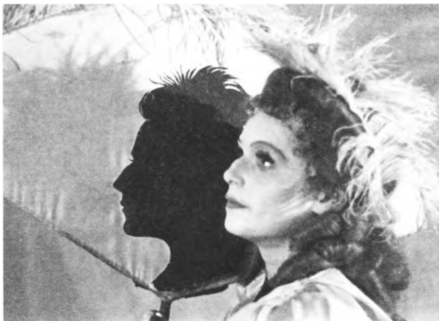
1943 г. «Мадмуазель Нитуш» Ф. Эрве