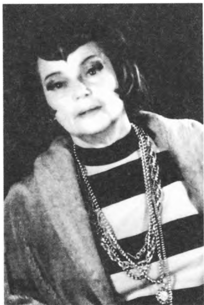
1997 г. Тигра в спектакле «Пух, Пух»