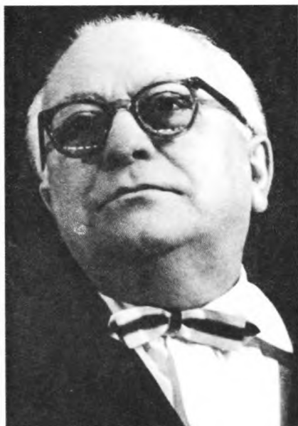
Художественный руководитель театра с 1939 года - Рубен Николаевич Симонов