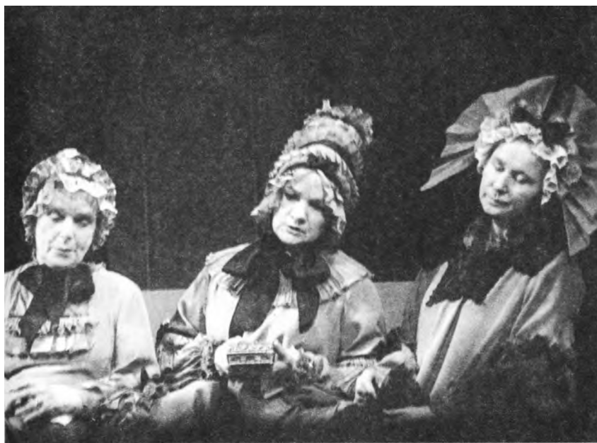
1995 г. «Пиковая дама» А. Пушкина. Сцена из спектакля