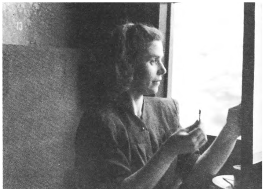
1950 г. На гастроли