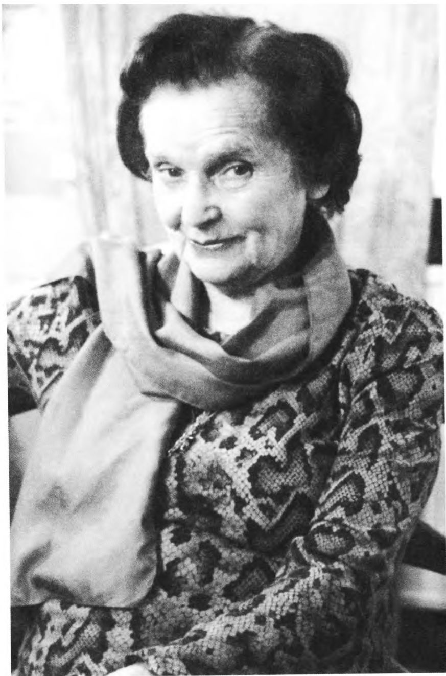
2009 г. Перед премьерой спектакля «Дядя Ваня» »