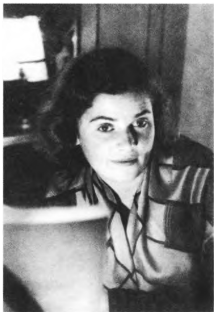
1934-й - год поступления в Школу-студию при театре им. Е. Вахтангова