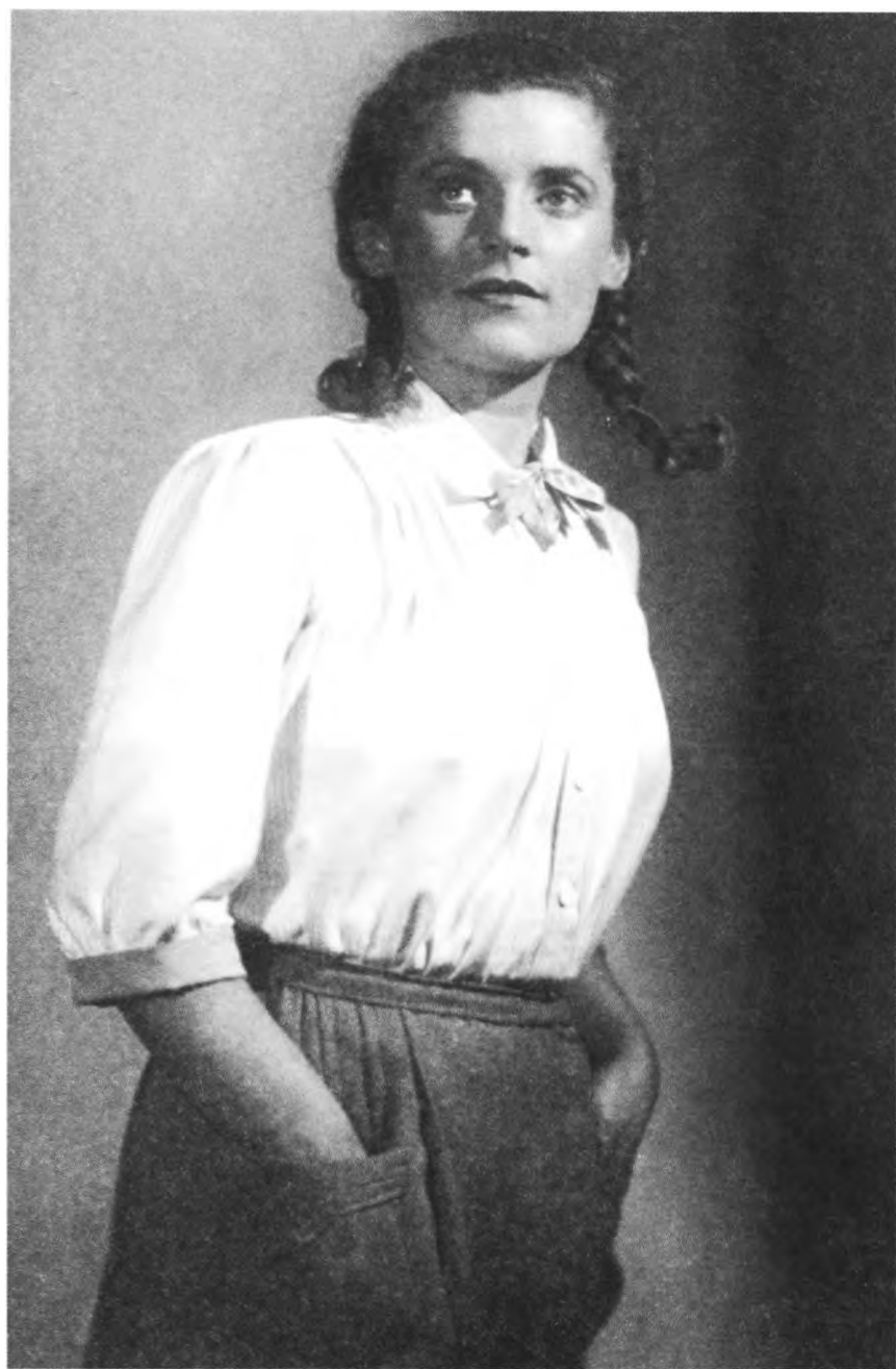
1939 г. Первая роль в театре - Санька в спектакле «Интервенция» Л. Славина