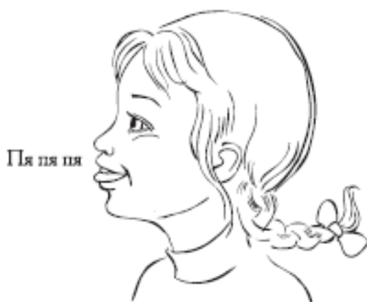
Пя пя пя