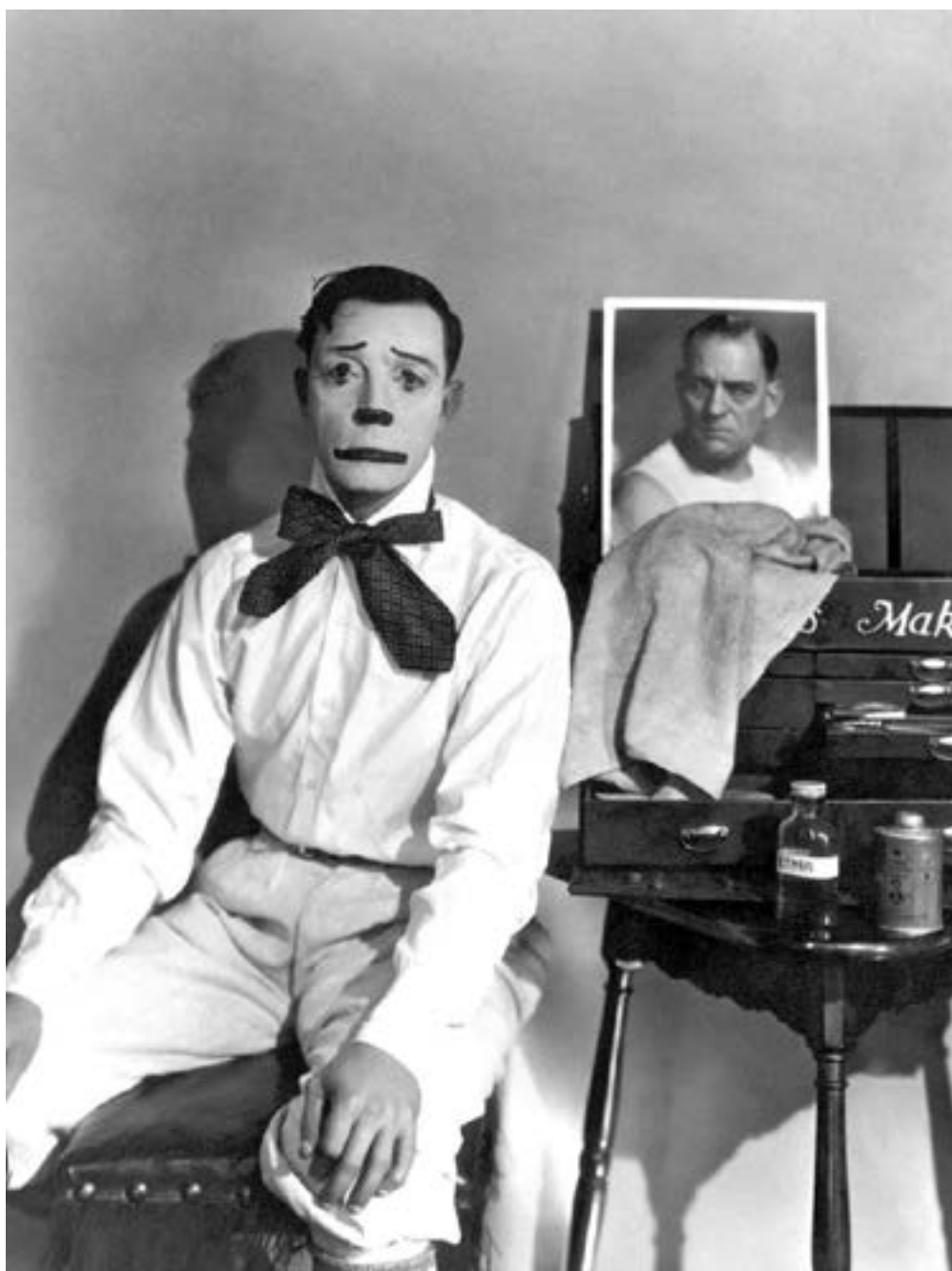
Американский актер Бастер Китон